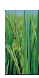
শীষ বের হওয়া