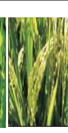
দানা জমাট বাধা